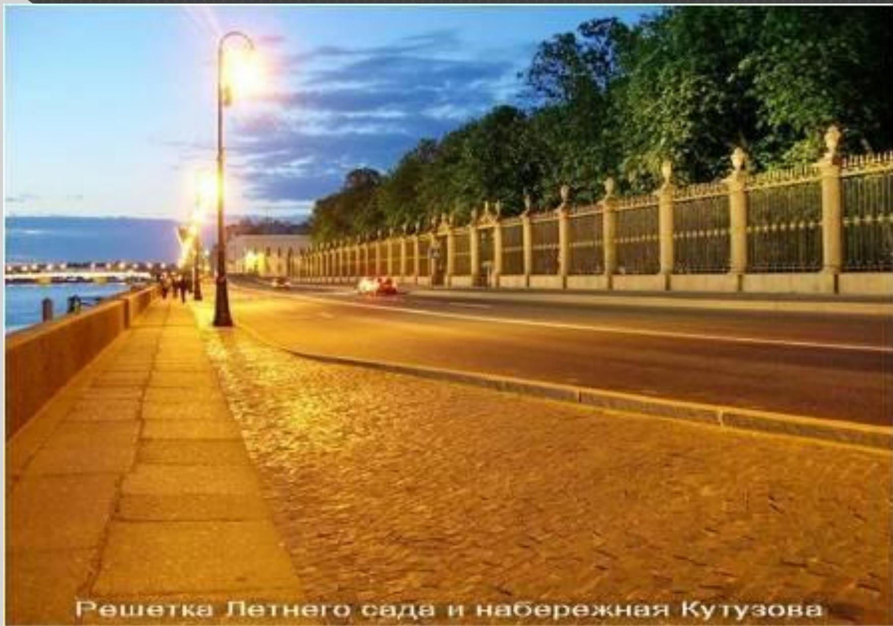
Решетка Летнего сада и набережная Кутузова