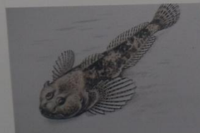
Обыкновенный подкаменщик Cottus gobio Linnaeus ОТРЯД СКОРПЕНООБРАЗНЫЕ СЕМЕЙСТВО КЕРЧАКОВЫЕ