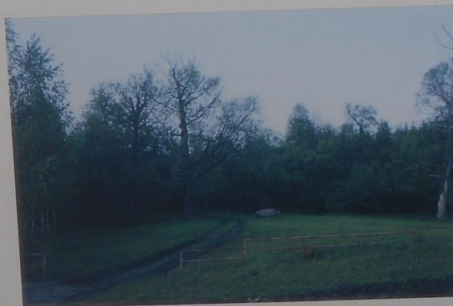
ПАМЯТНИК ПРИРОДЫ БЕЛИНСКИЙ ЛЕС