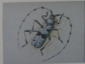
Усач альпийский Rosalia alpina ОТРЯД ЖЕСТКОКРЫЛЫЕ СЕМЕЙСТВО УСАЧИ