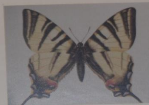
Подалирий Iphiclides podalirius ОТРЯД ЧЕШУЕКРЫЛЫЕ СЕМЕЙСТВО ПАРУСНИКИ