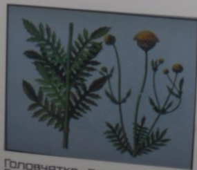
Голозачатка Литвинова Cephalaria litvinavii Bobr СЕМЕЙСТВО ВОРСЯНКОВЫЕ