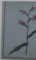
Пальчеголовник Cerphalanthus r. СЕМЕЙСТВО ЯТР