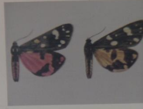
Медведица - госпожа Callimorpha dominula ОТРЯД ЧЕШУЕКРЫЛЫЕ СЕМЕЙСТВО МЕДВЕДИЦЫ