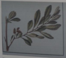
Восковница обыкновенная Myrica gale СЕМЕЙСТВО ВОСКОВНИКОВЫЕ