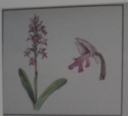
Ятрышник шлемоносный Orchis militaris СЕМЕЙСТВО ЯТРЫШНИКОВЫЕ