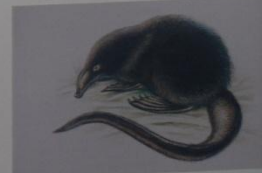
Выхухоль Desmana moschata Linnaeus