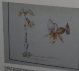
Надбордник безлиственный Epipodium arhullum СЕМЕЙСТВО ЯТРЫШНИКОВЫЕ