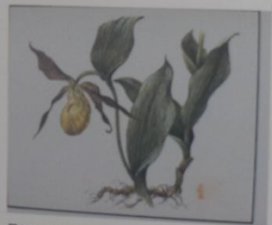
Башмачок настоящий Cypripedium calceolus СЕМЕЙСТВО ЯТРЫШНИКОВЫЕ