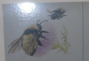
Шмель армянский Bombus armeniacus Radoszkowski ОТРЯД ПЕРЕПОНЧАТОКРЫЛЫЕ СЕМЕЙСТВО ПЧЕЛЫ