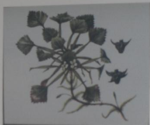
Водяной орех Чилим Trapa natans СЕМЕЙСТВО ТРАПАСЕЕ