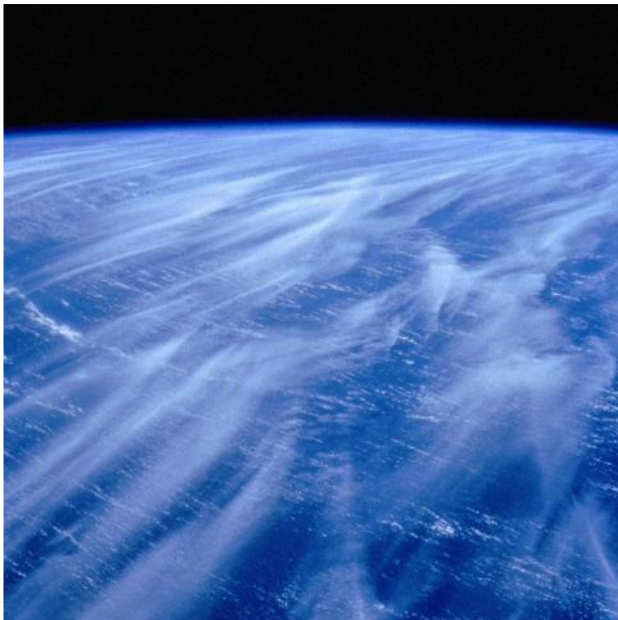
Вид облаков из космоса