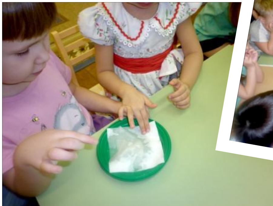
Опыт «Вода впитывается»