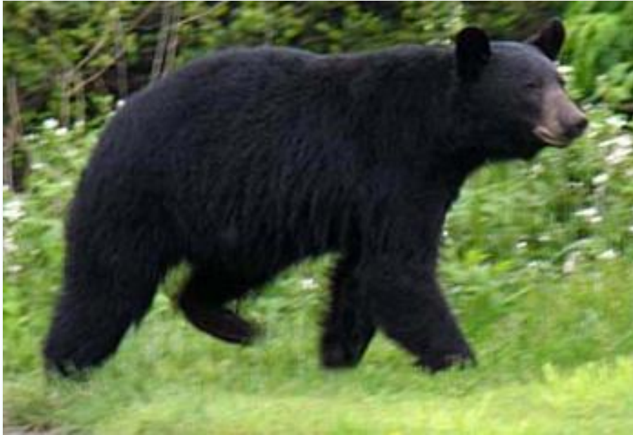
Чёрный медведь (Барibal)