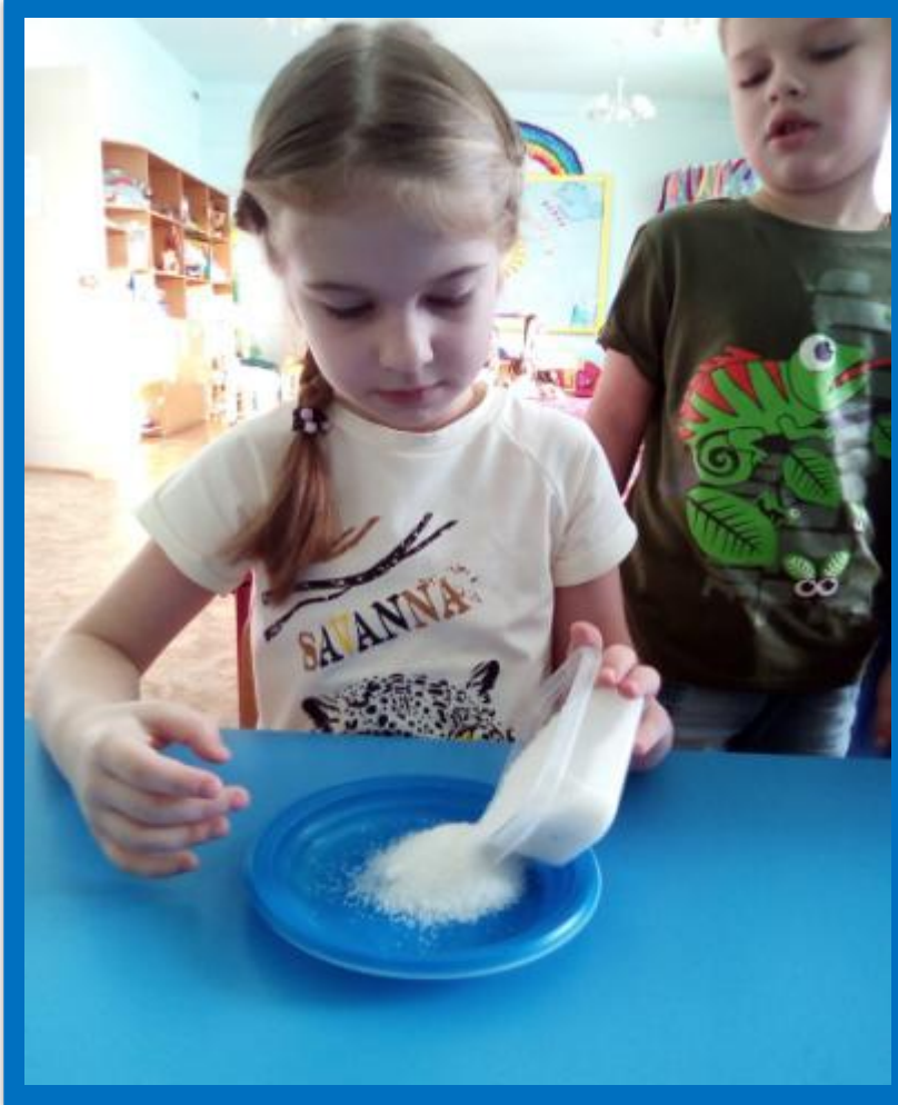
Опыт с сахаром.