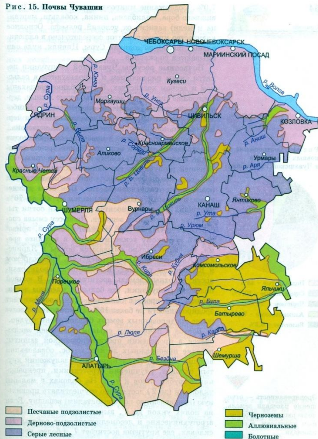
Рис. 15. Почвы Чувашии

В Чувашии почвенный покров разнообразен. С севера на юг происходит смена четырех типов почв: подзолистых, серых лесных, дерново-подзолистых, черноземов. Черноземы распространены на юго-западе и юге – востоке нашей республики.