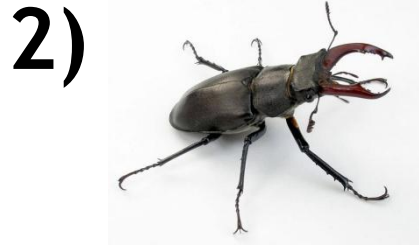
Жук - олень