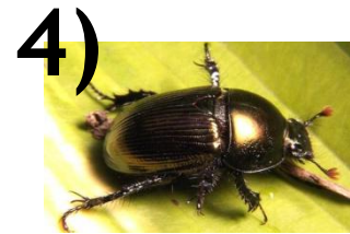
Жук - киборг