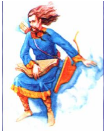
Стрибог - бог ветров