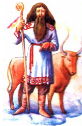
Велес - бог скотоводства и торговли