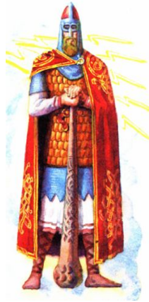
Перун - главный бог славян