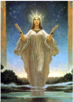
Лада - богиня любви и красоты