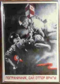
ПОГРАНИЧНИК, СМЫ ОТПОР ВРАГЪ