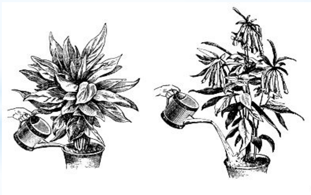
Поливка растений: слева - правильная поливка; справа - неправильная поливка

Когда необходимо предохранить от воды корневую шейку, поливку производят только по краю земляного кома, где находится главная масса молодых корней (например, так поливают цикламен во время цветения).