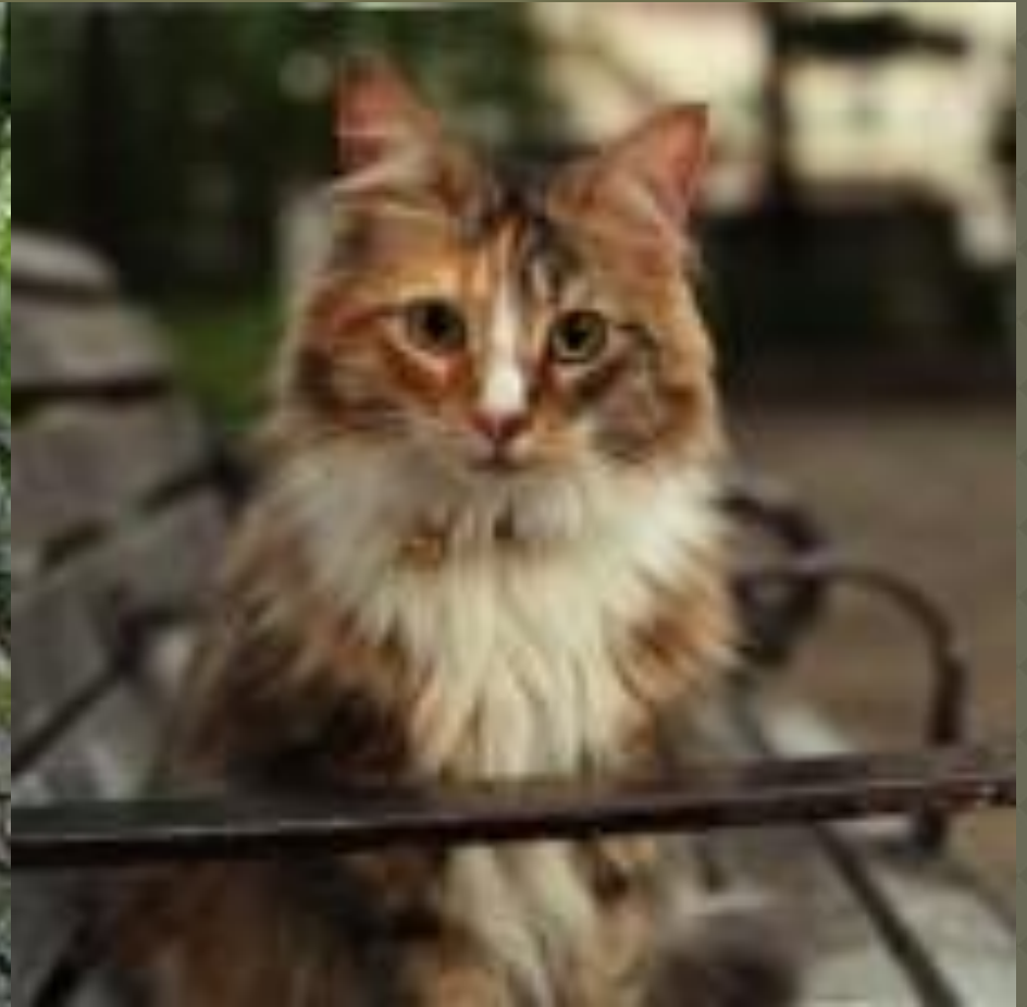
Норвезький лісовий кіт