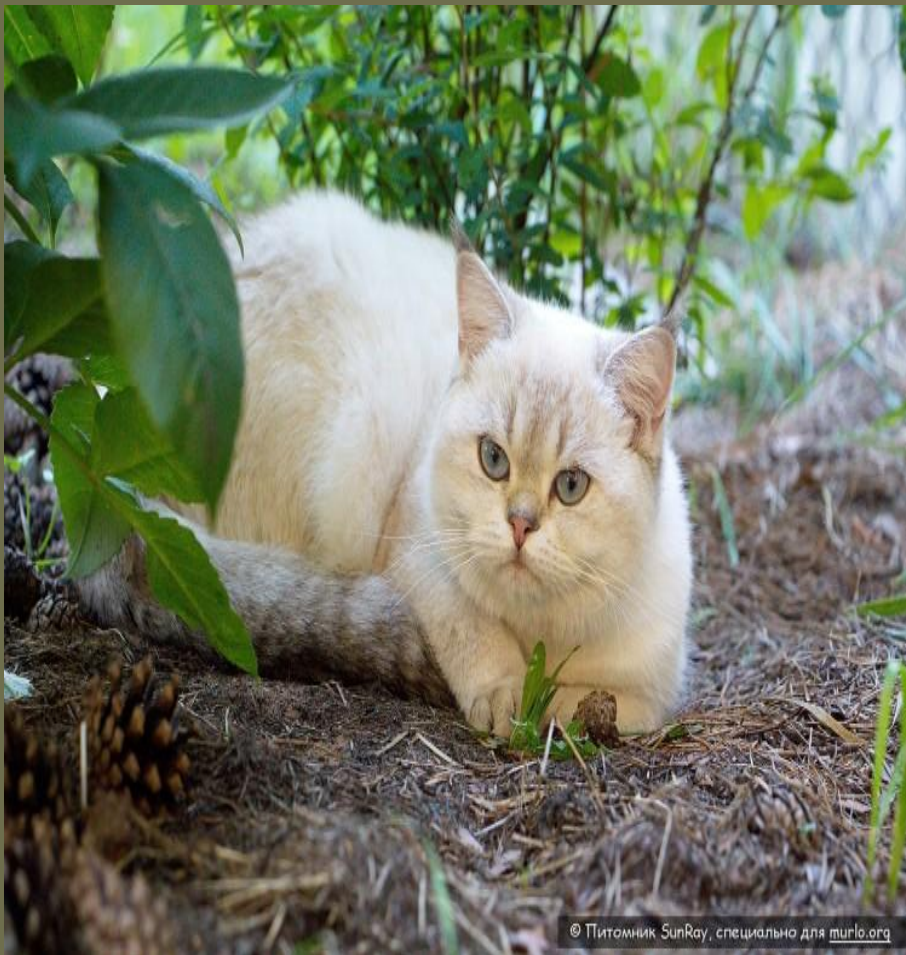
Британський короткошерстий кіт