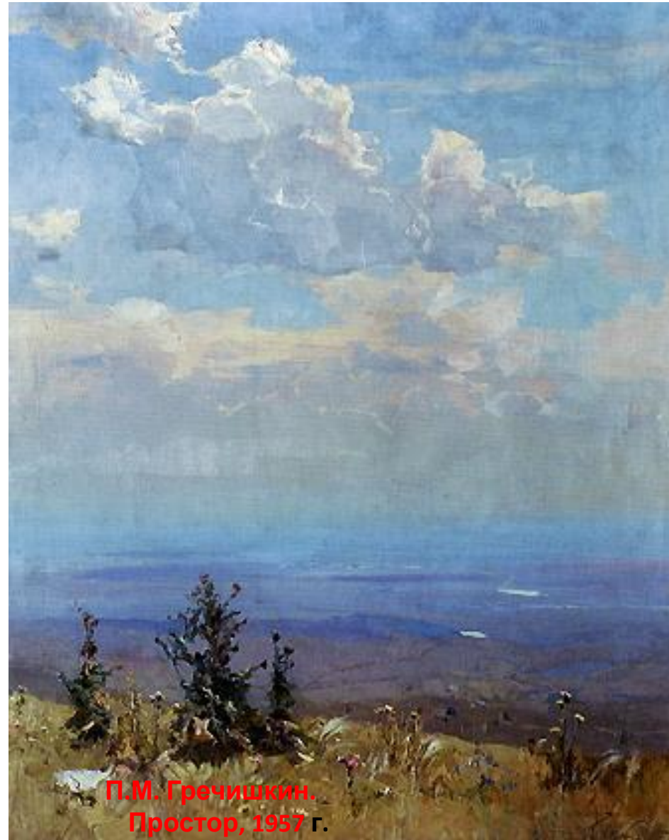
П.М. Гречишкин. Простор, 1957 г.