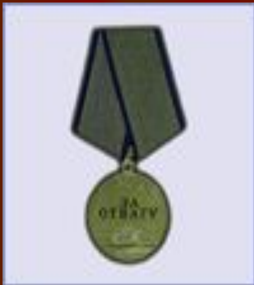
медаль "За Отвагу"