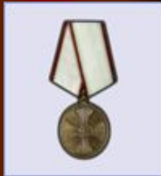
медаль "За спасение погибших"