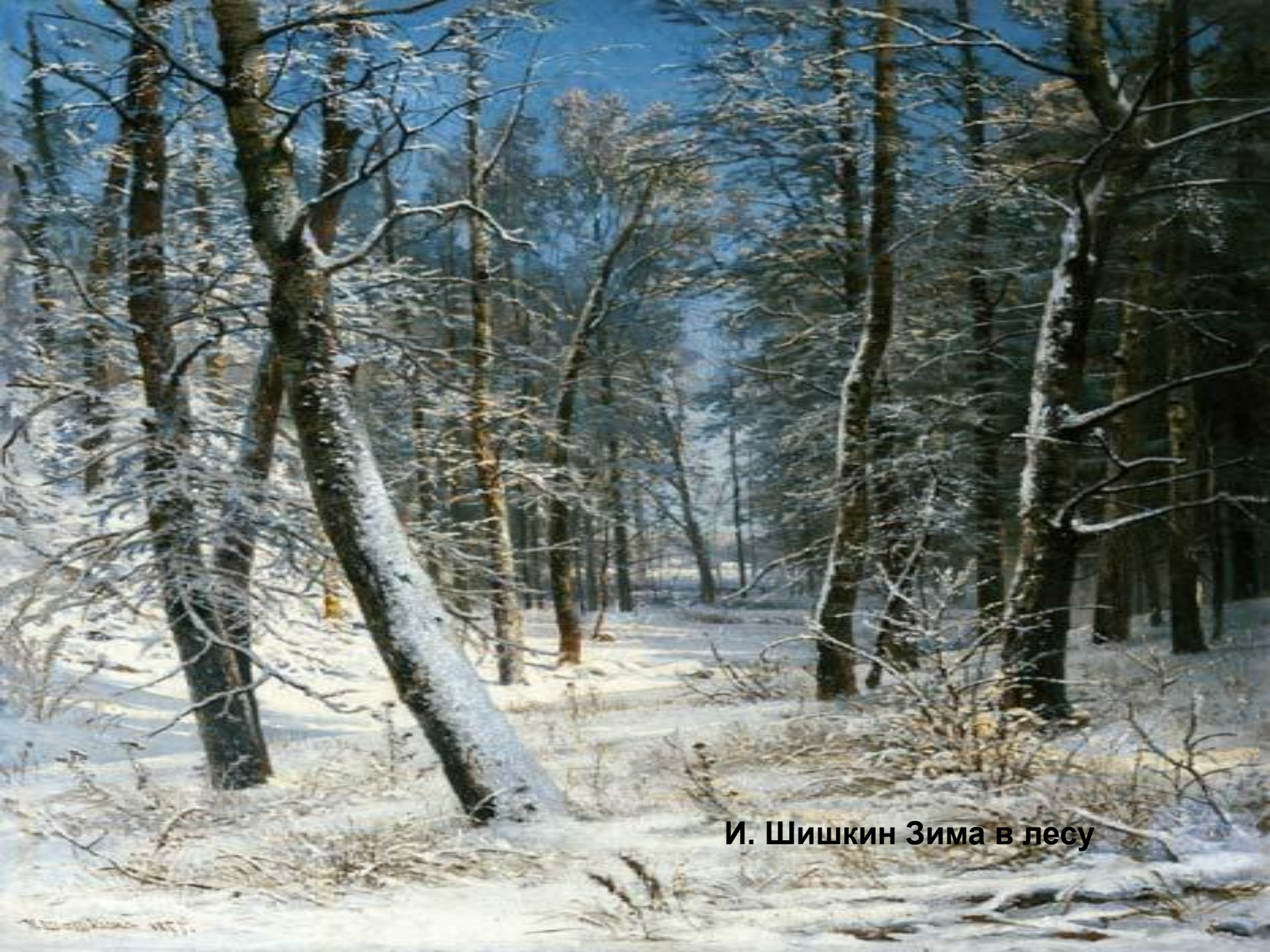
И. Шишкин Зима в лесу