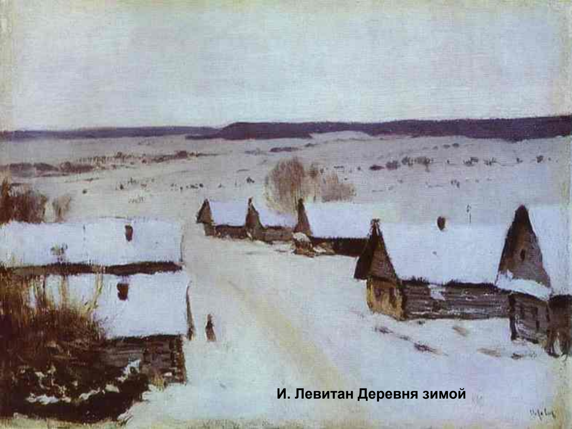
И. Левитан Деревня зимой