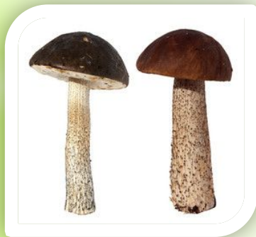
Под березой растут подберезовики