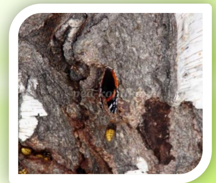
В трещинах коры прячутся насекомые