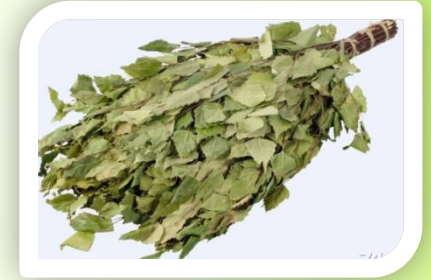
Из веток березы делают веники