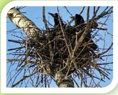
На березе вьют гнезда птицы