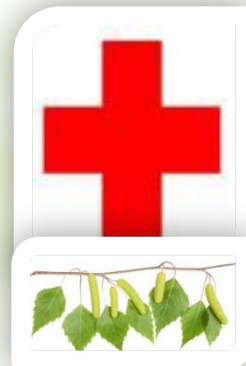
Березу используют в медицине