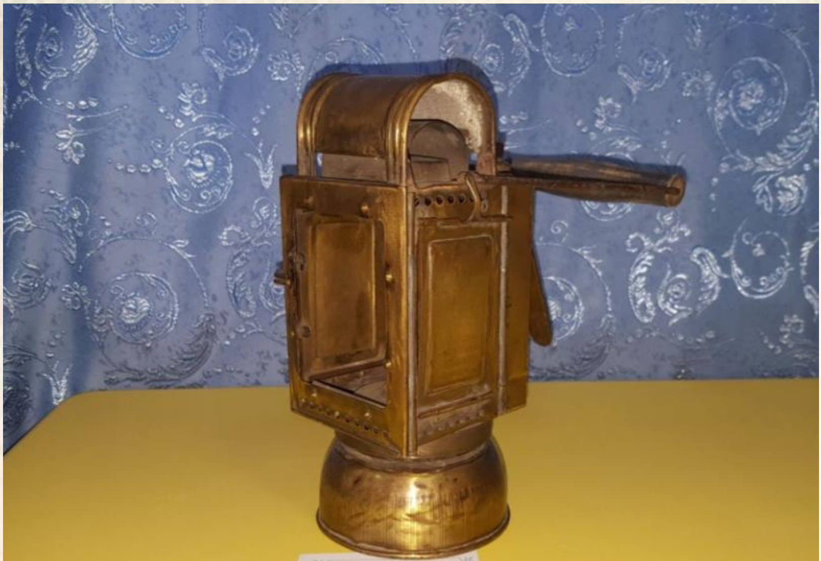
Светильник лампы карманного назначения для переноски и хранения