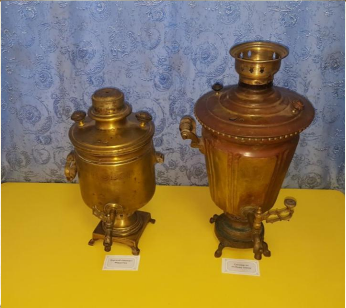
Самовар из меди