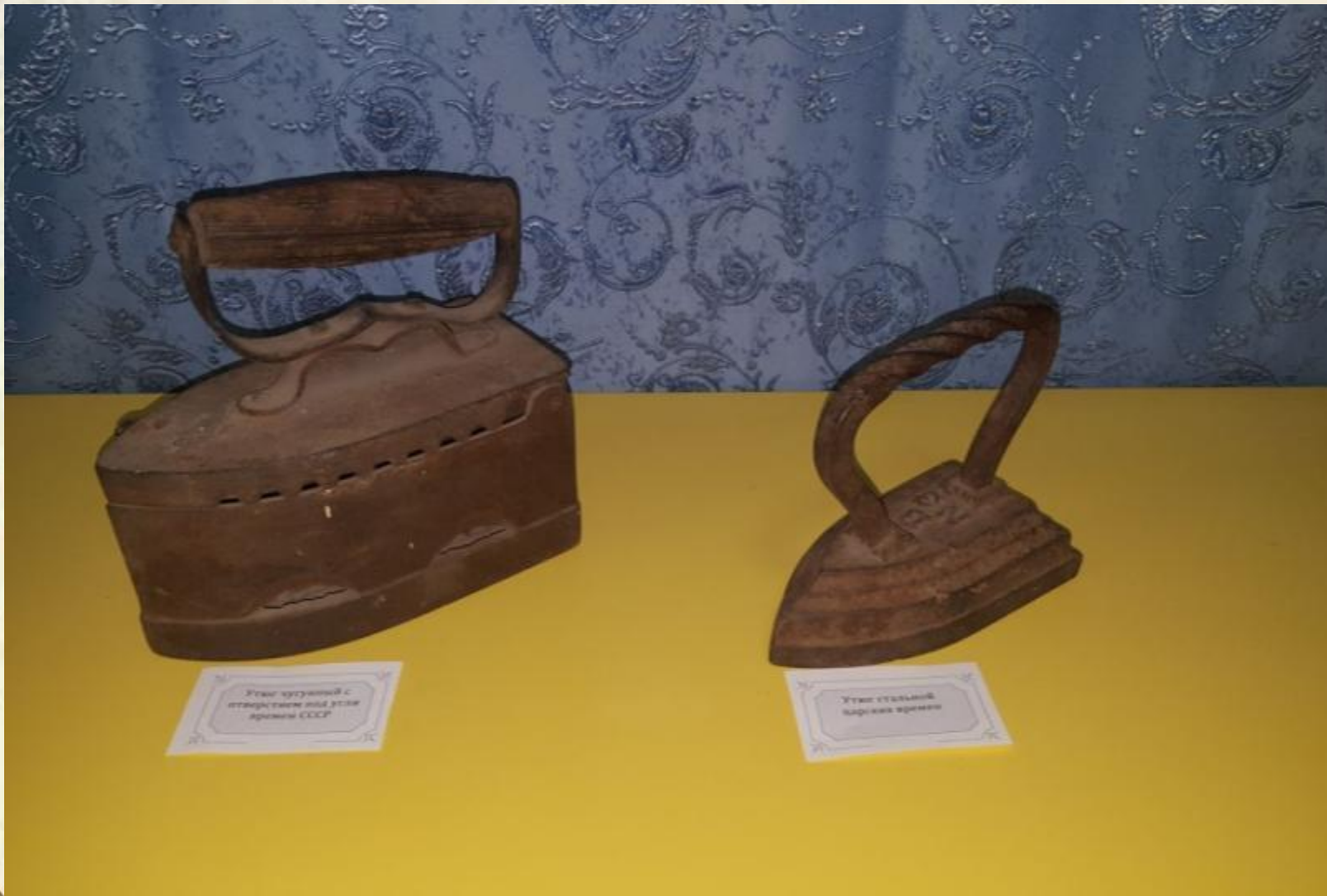
Утюг чугунный с отверстием под угля времен СССР