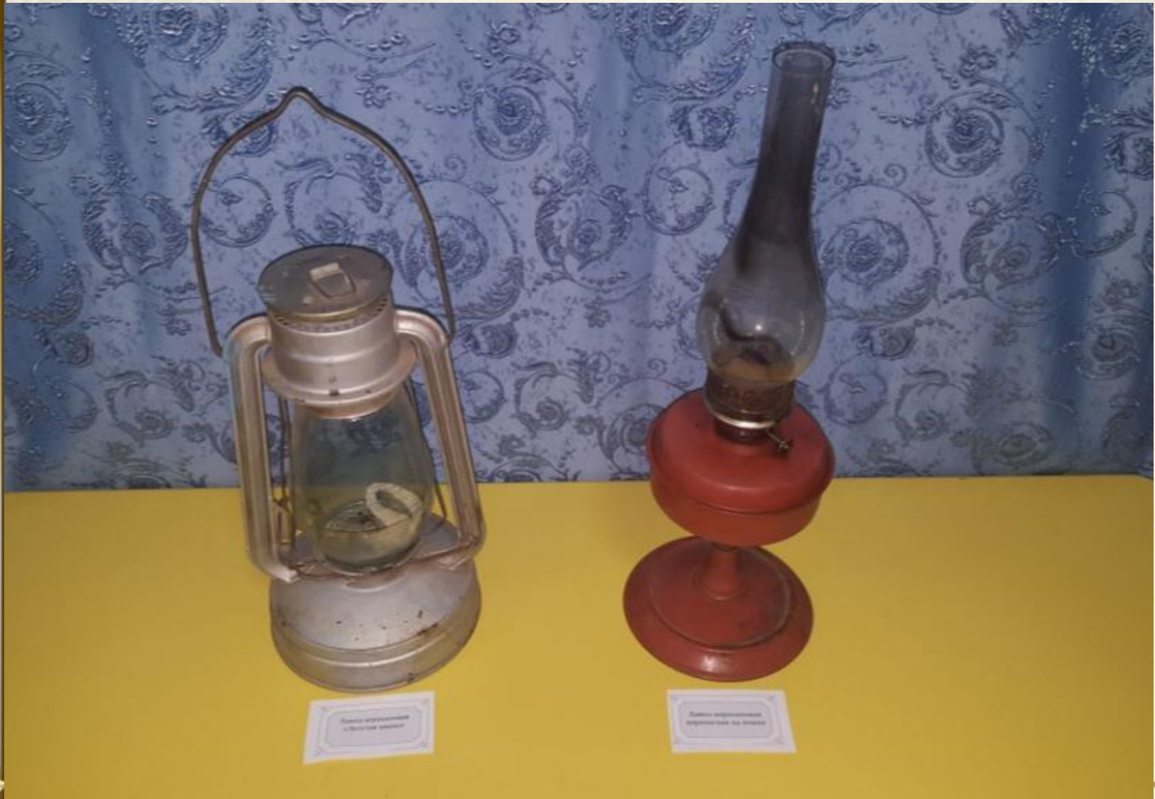
Лампа керосиновая с металлическим корпусом