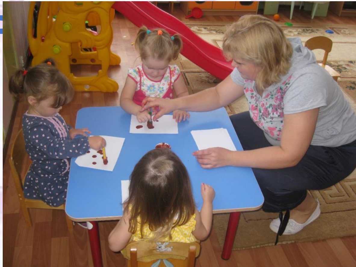
Художественная деятельность «Кошачьи лапки»