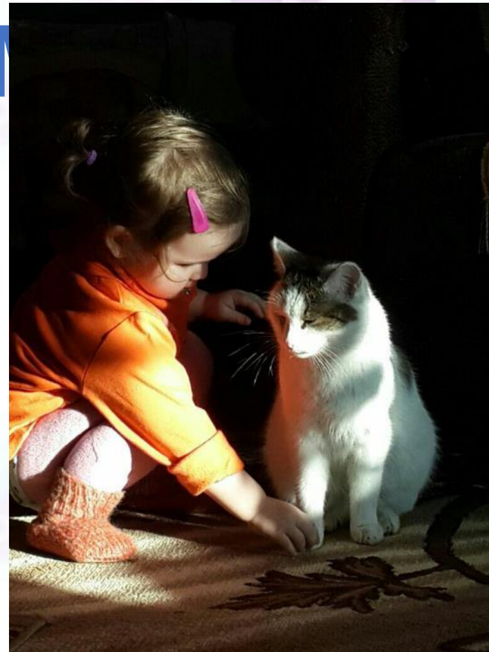
Любимый кэтти Барсик Амины