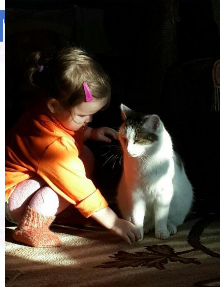
Любимый кэтти Барсик Амины