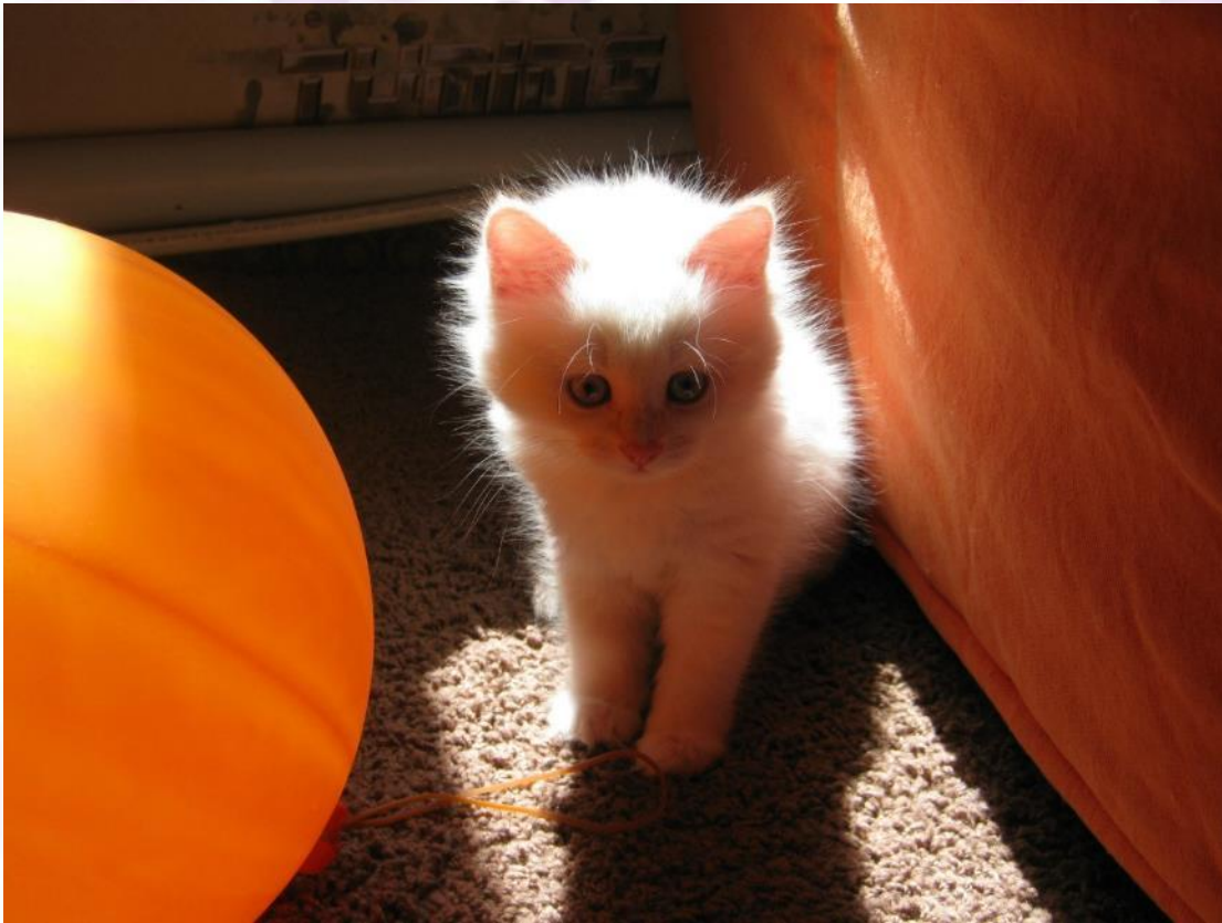
Кошечка Маська-любимица Таисии