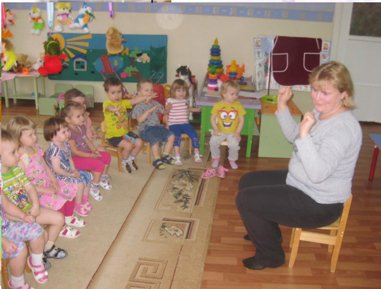
Игра «Волшебный мешочек»