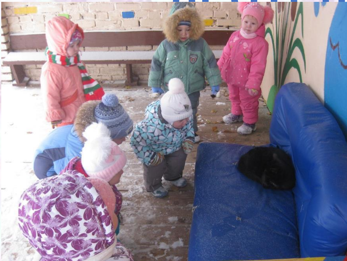
НАБЛЮДЕНИЕ ЗА КОШКОЙ НА УЛИЦЕ