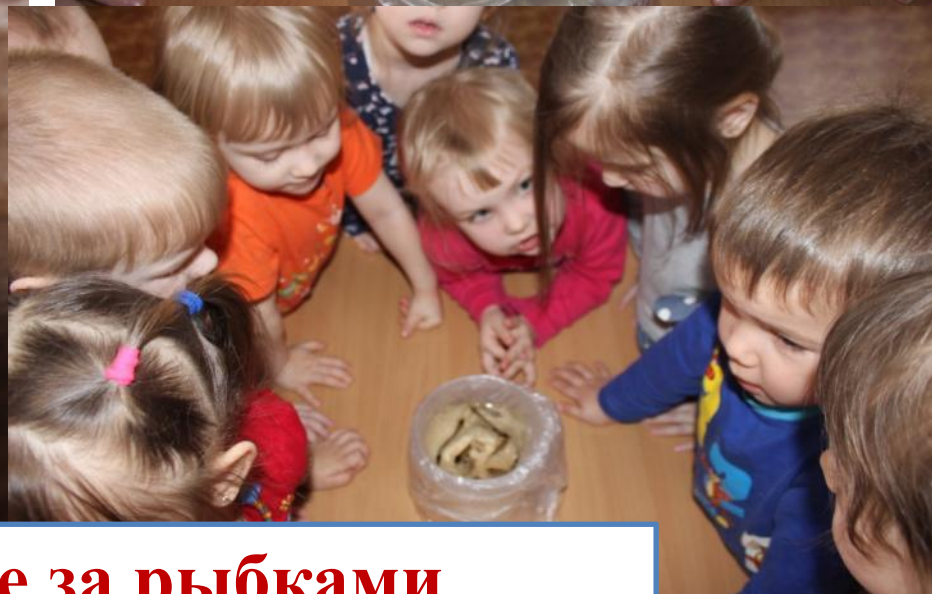
Наблюдение за рыбками