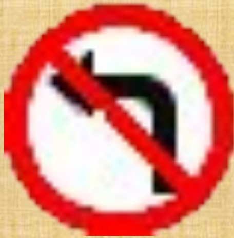
Поворот налево запрещен