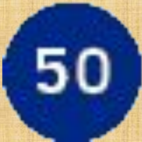
Ограничение минимальной скорости