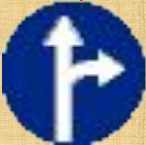
Движение прямо или направо