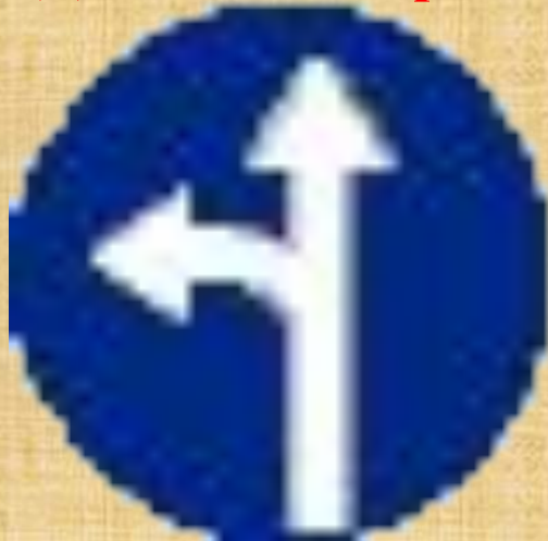
Движение прямо или налево