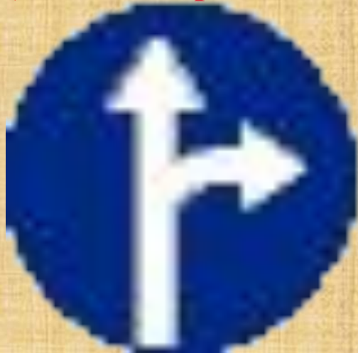
Движение прямо или направо