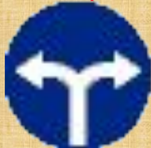
Движение направо или налево