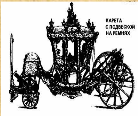
КАРЕТА С ПОДВЕСКОЙ НА РЕМНЯХ