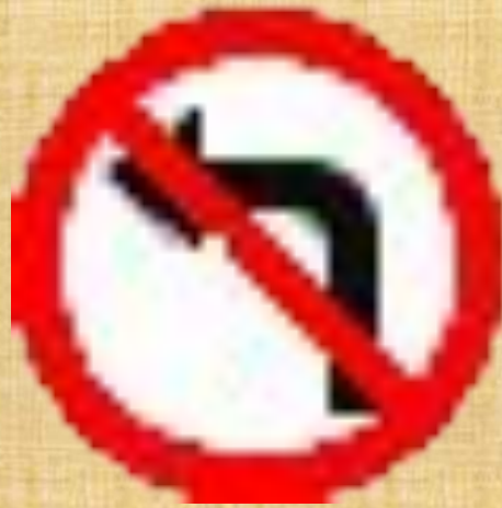
Поворот налево запрещен