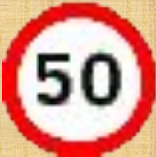
Ограничение максимальной скорости