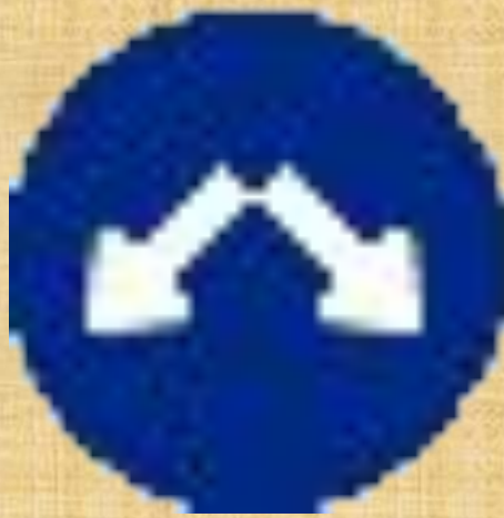
Объезд препятствия справа или слева