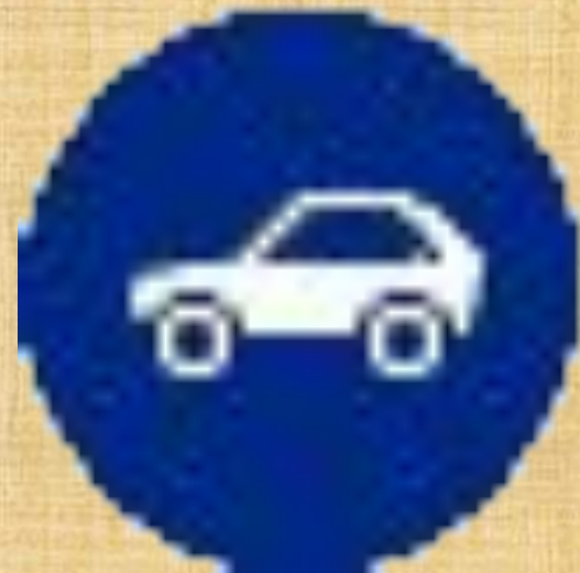
Движение легковых автомобилей