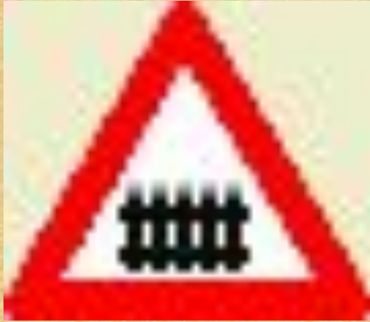
Железнодорожный переезд со шлагбаумом