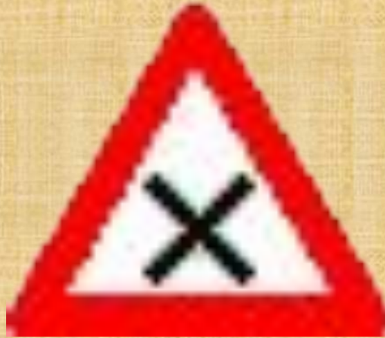
Пересечение равнозначных дорог