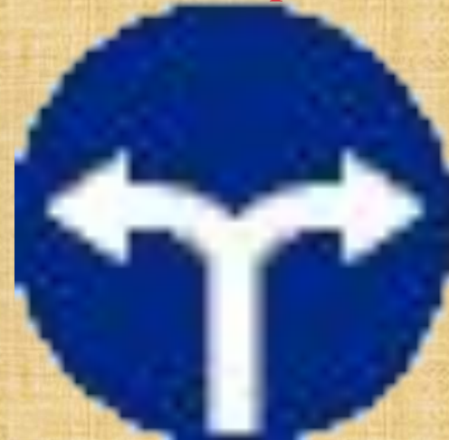
Движение направо или налево