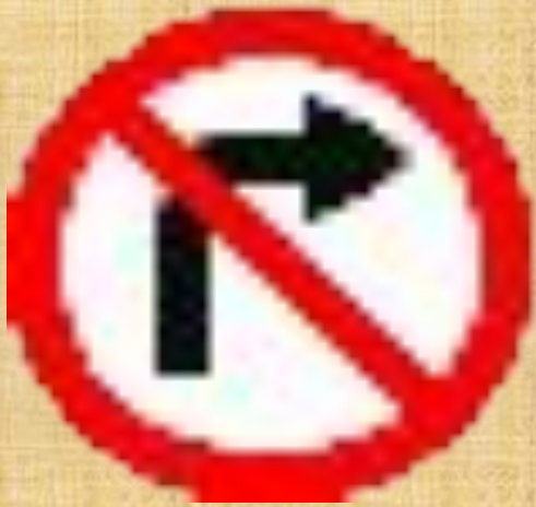
Поворот направо запрещен