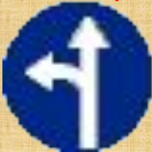
Движение прямо или налево