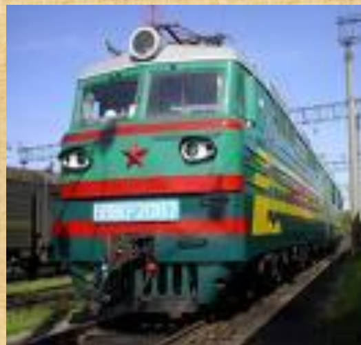
наземный вид рельсового транспорта