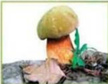
белый гриб (дубовый)