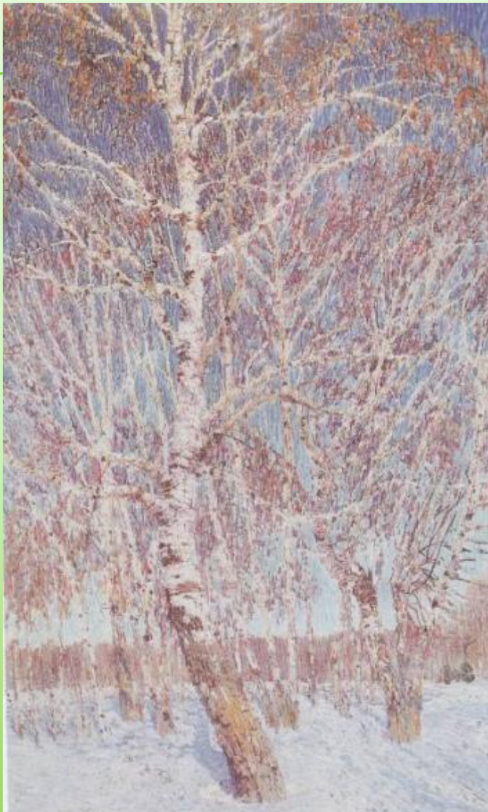
И. Грабарь Февральская лазурь