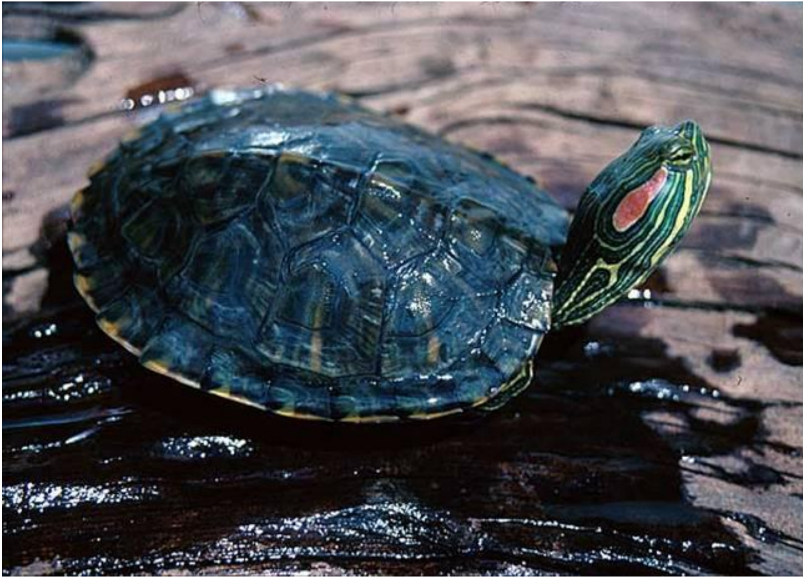
красноухая скользящая черепаха