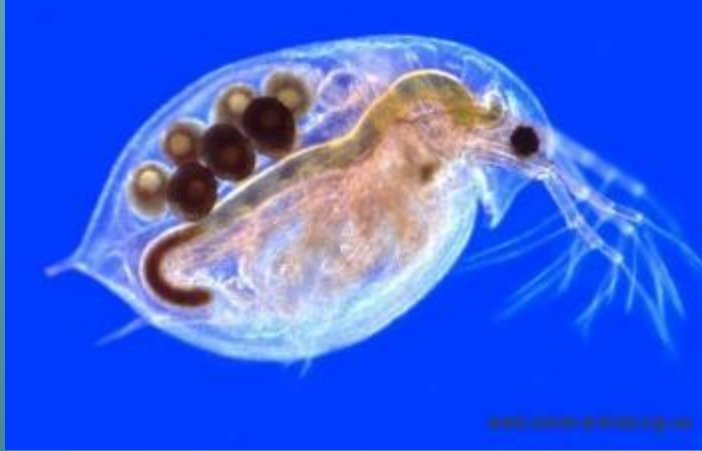
рачок дафния (Мелкие ракообразные)