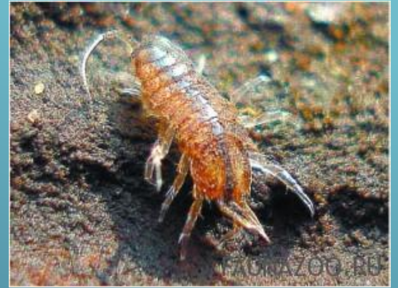
ВОДЯНОЙ ОСЛИК (Мелкие ракообразные)