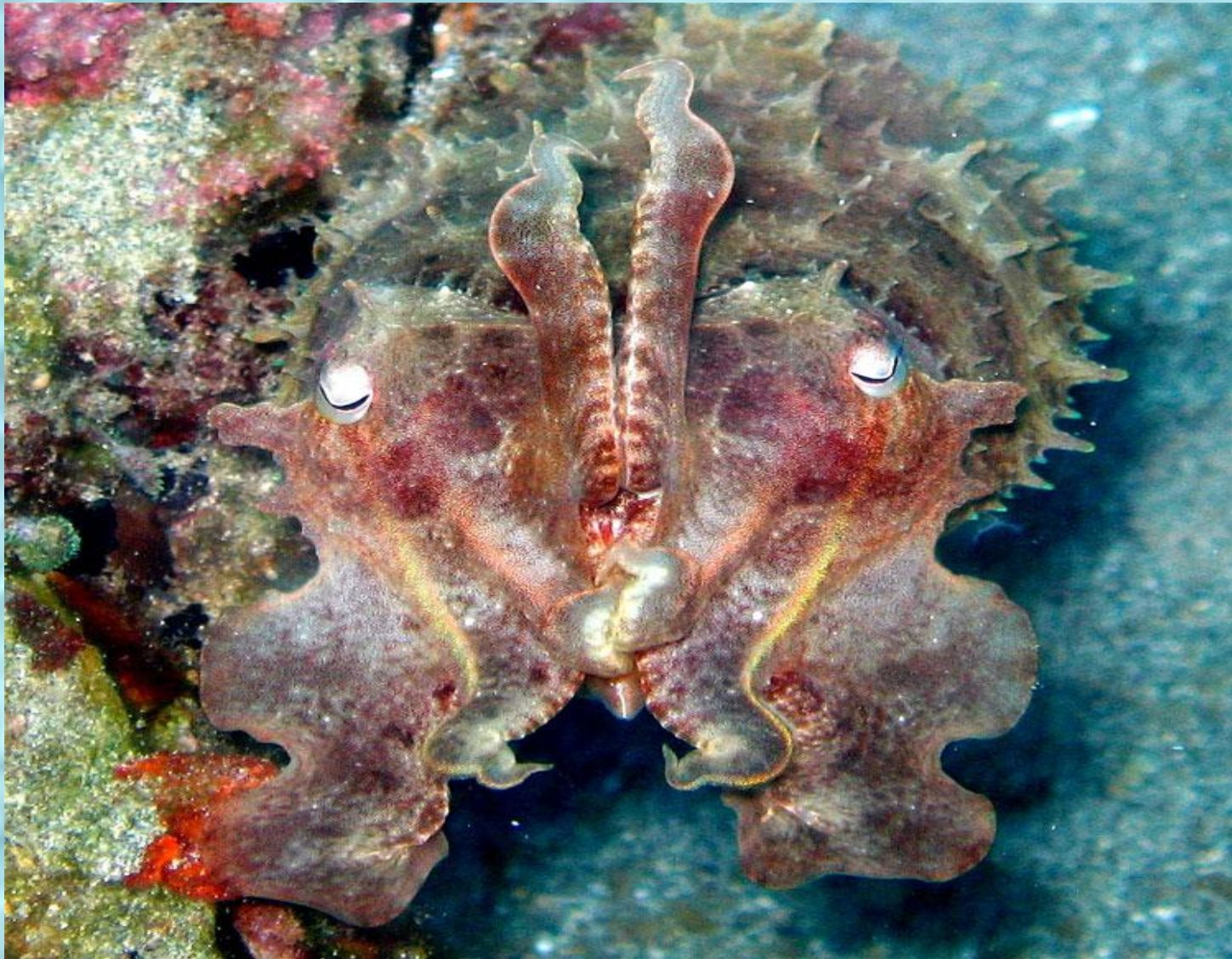
Превосходный небольшой кальмар