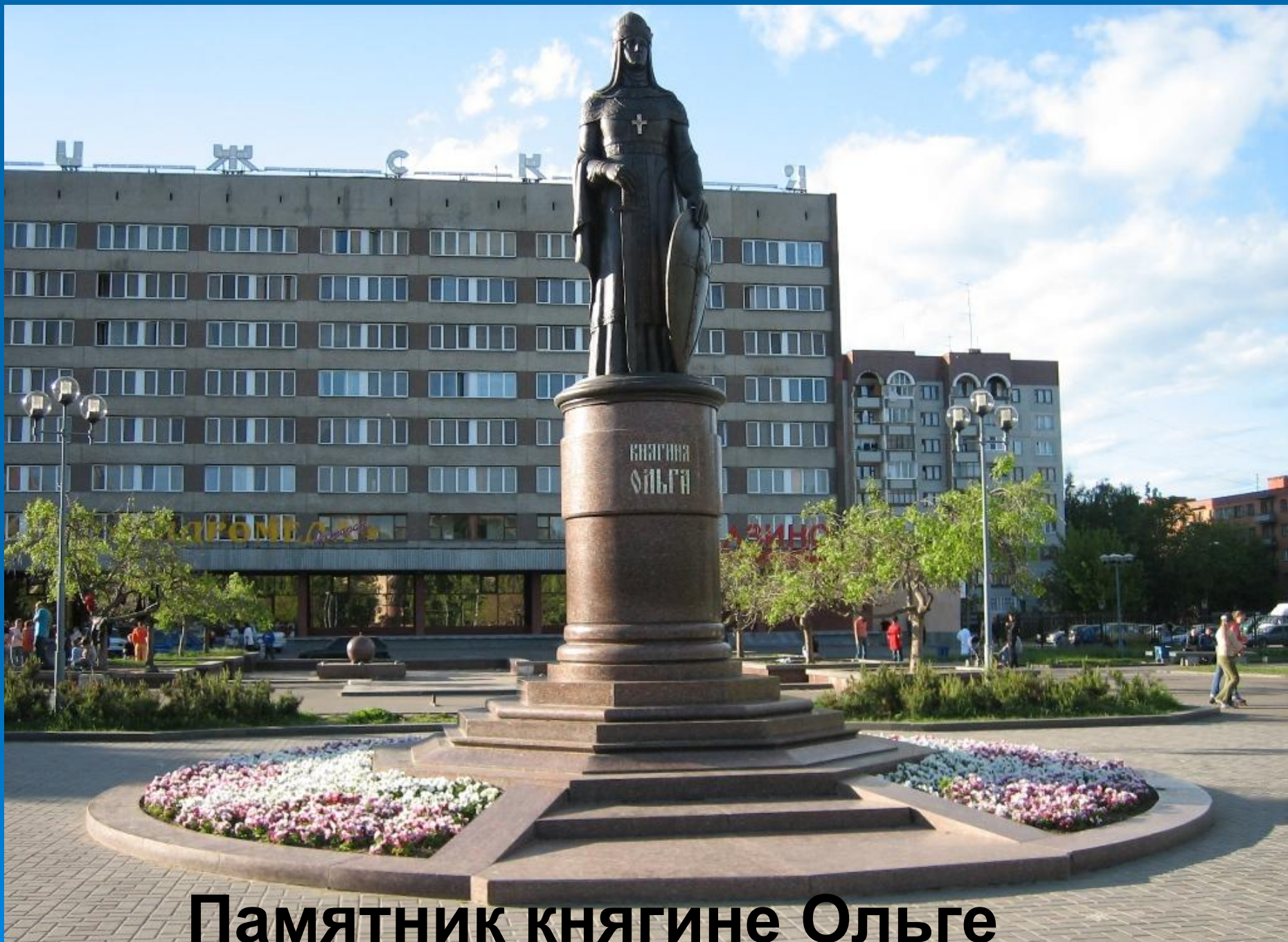
Памятник княгине Ольге