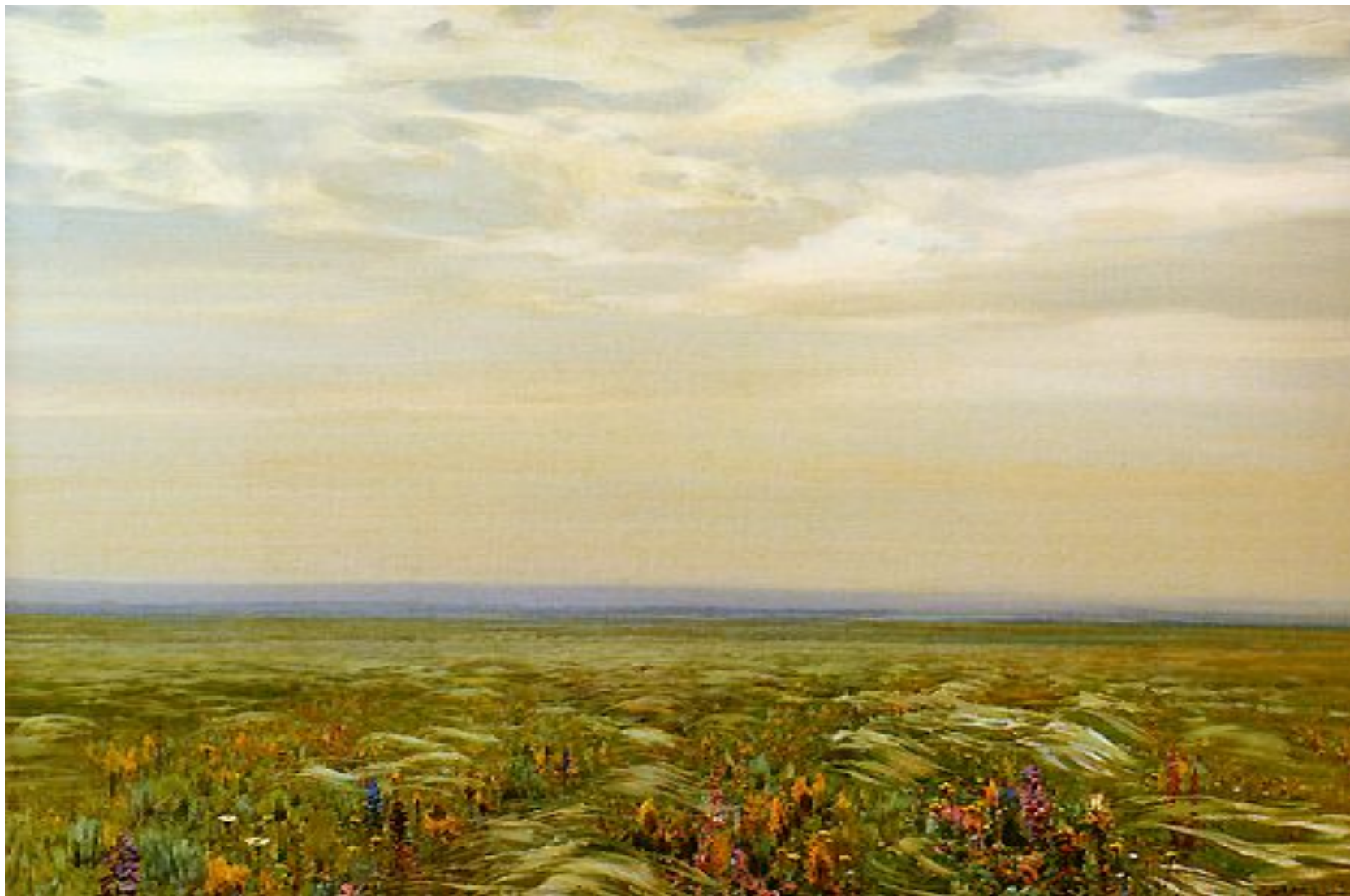
Степь ковыльная П. Гречишкин