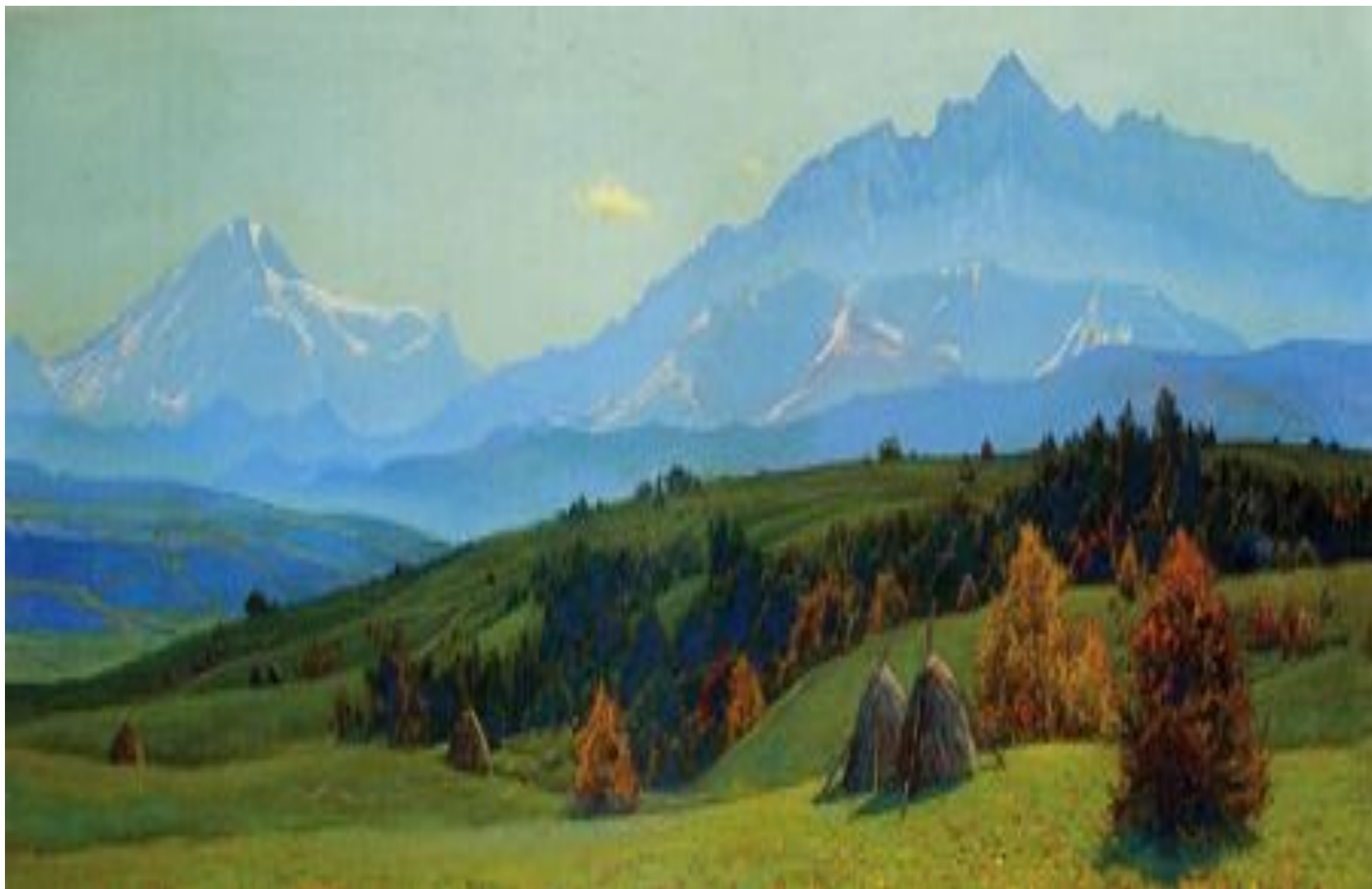
Предгорье Кавказа П. Гречишкин