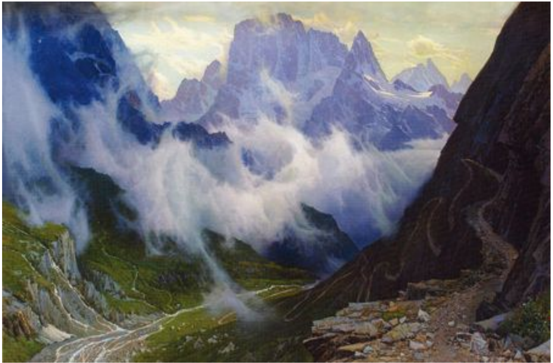
Ущелье П. Гречишкин