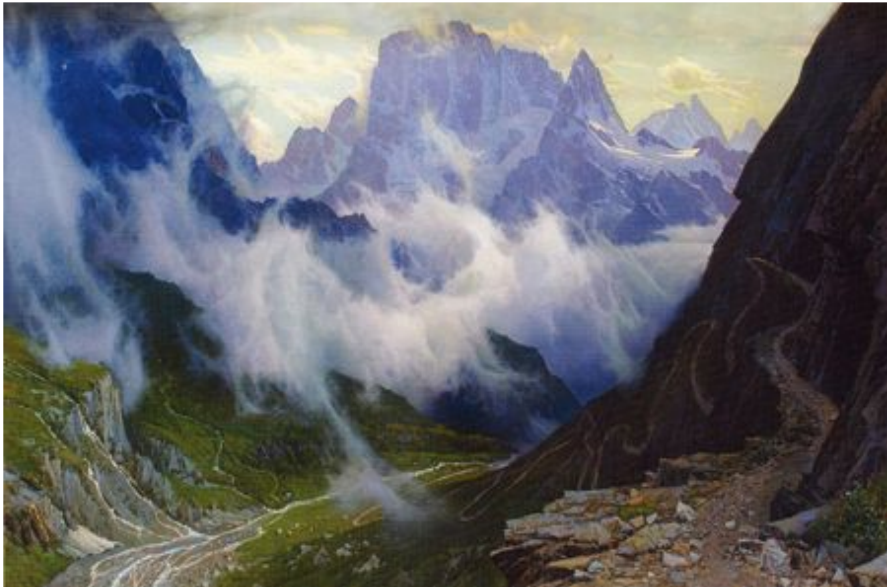
Ущелье