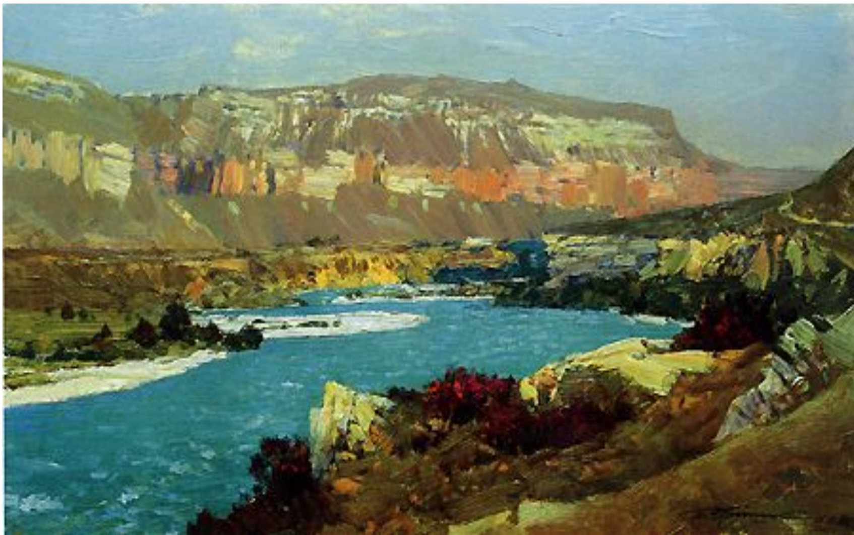
Река Кубань П. Гречишкин