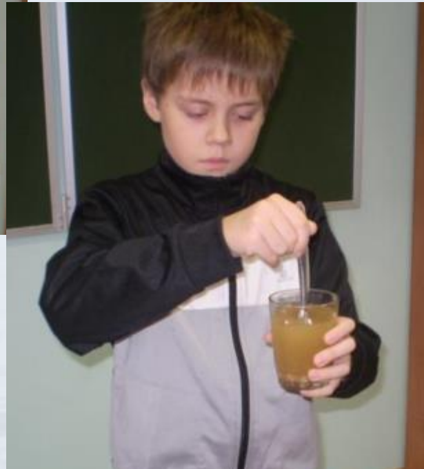
Вода с песком