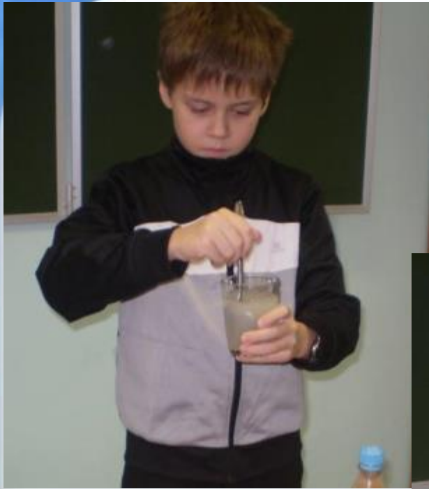
Вода с солью