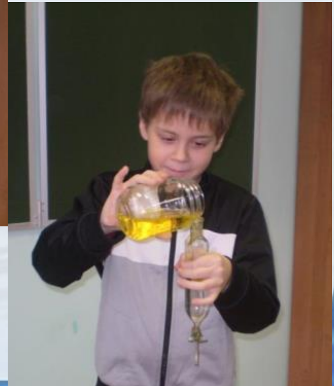
Вода с маслом