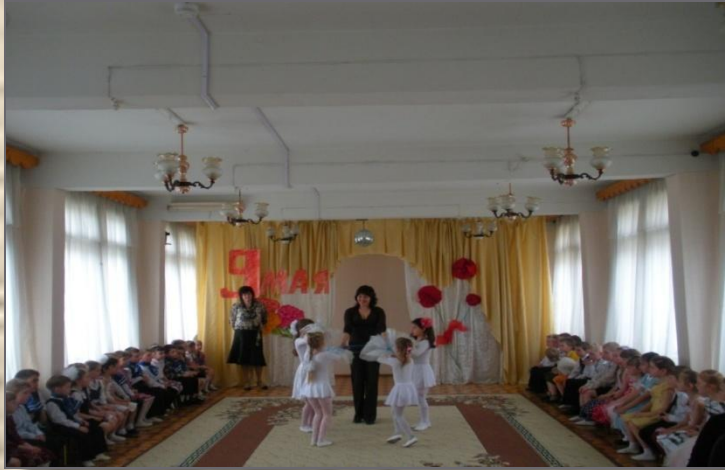
Танец «Белые голуби»