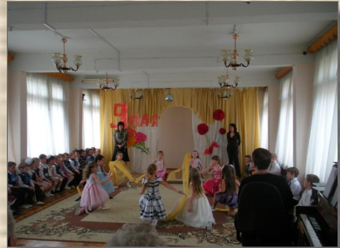
Танец «Не отбирайте солнце у детей»