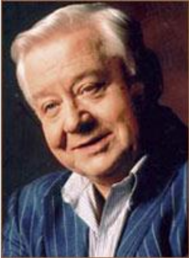
Актер театра и кино Олег Павлович Табаков