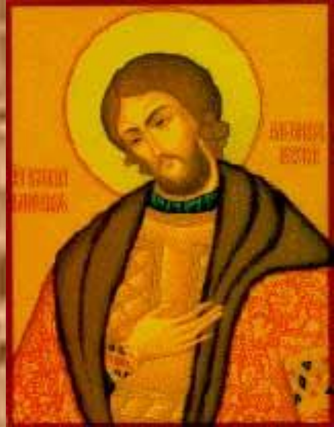
Святой Александр Невский (икона)