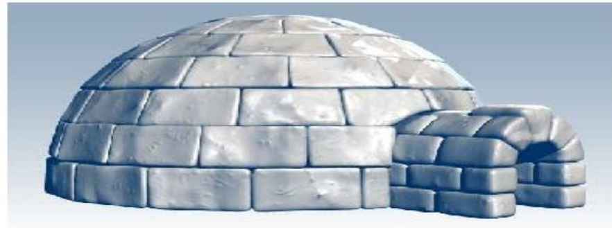
Иглу - сложенное из снега зимнее жилище эскимосов