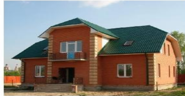
Деревянный и кирпичные дома — жилища народов средней полосы России