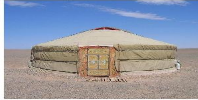
Юрта — жилище народов степи