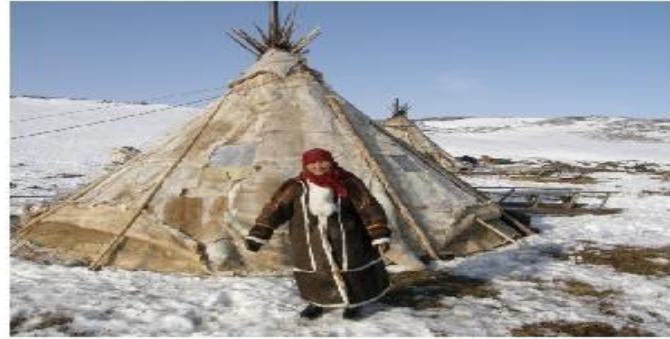
Чум — жилище народов севера