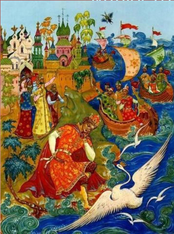
«Сказка о царе Салтане...»