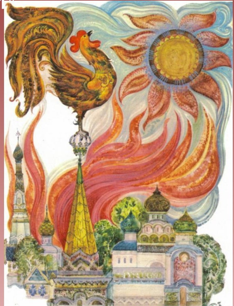
«Сказка о золотом петушке...»