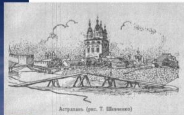
Астрахань (рис. Т. Шевченко)

Это Кремль- первая постройка в городе! Но вначале он был деревянным, а после частых пожаров его перестроили и сделали каменным.