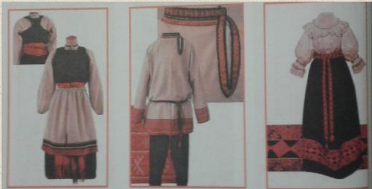
Русские народные свадебные костюмы

Есть одежда, которая храниться в музеях. Это национальная народная одежда.