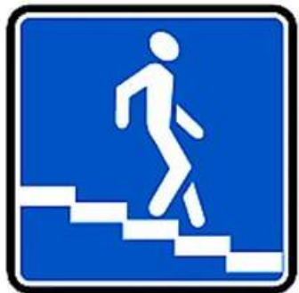
Знак «Подземный пешеходный переход»