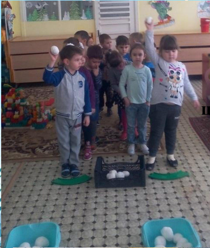
«Попади в цель»(эстафета)