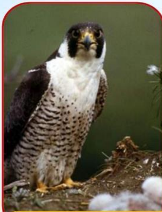
Сокол - сапсан