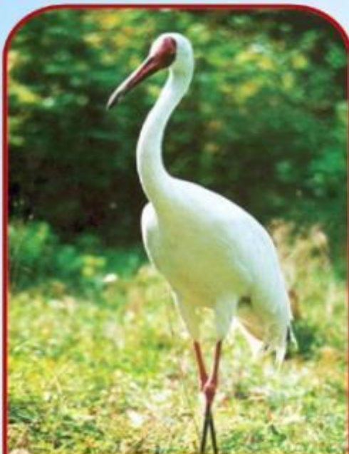
Стерх, белый журавль