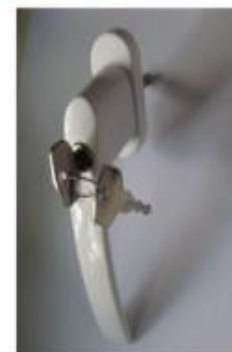
Ручка с замком

Предназначены для ограниченного открывания окон, дверей, фрамуг и т.д.