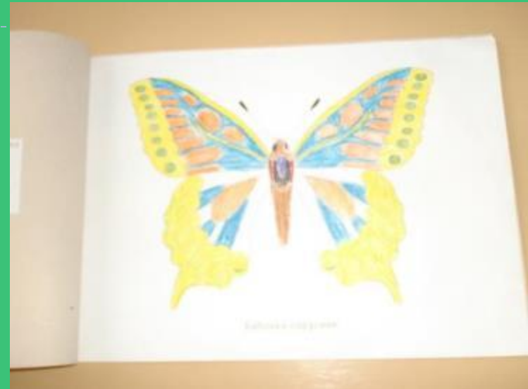
Бабочка - парусник