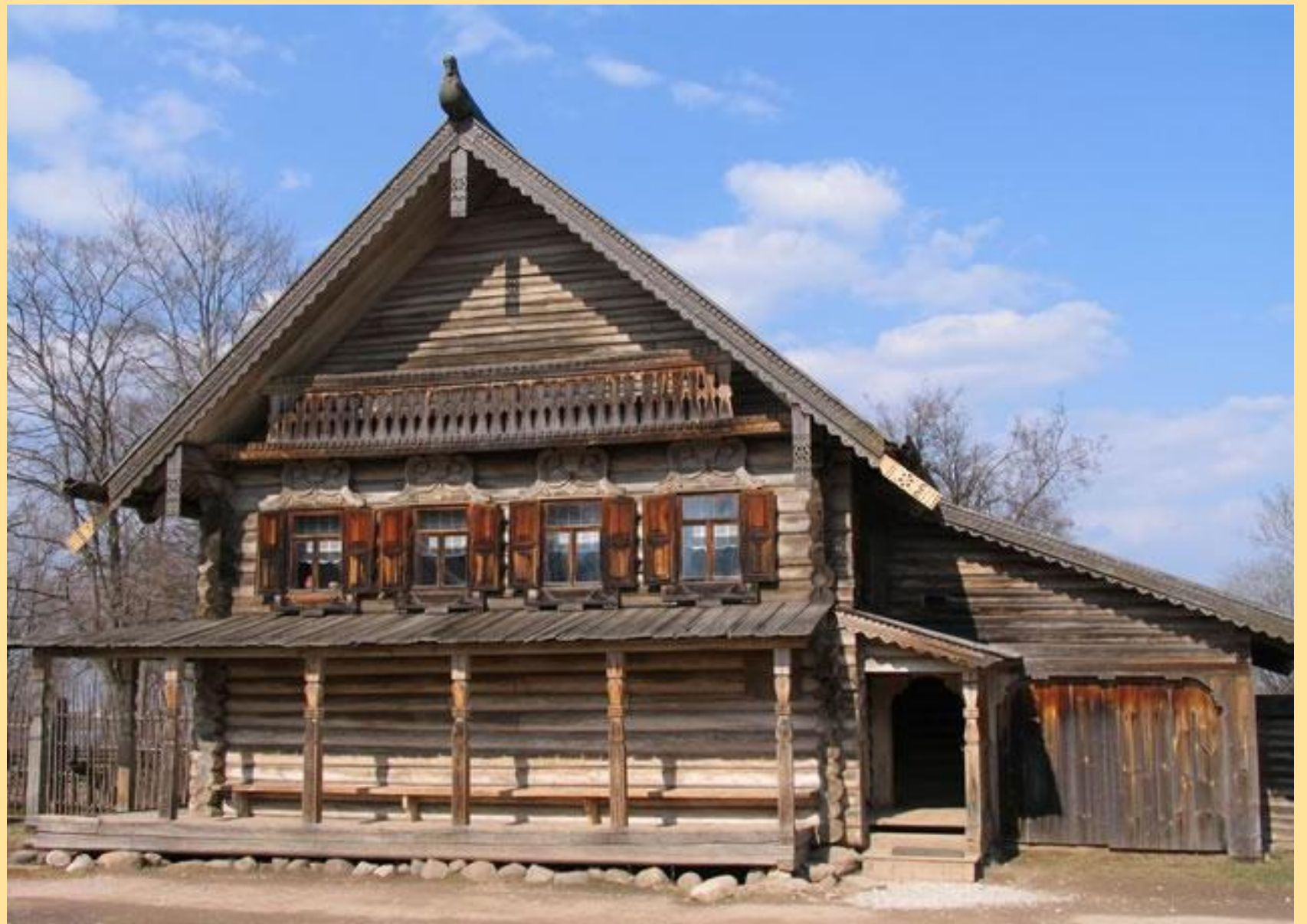
Старинные избы строили из брёвен