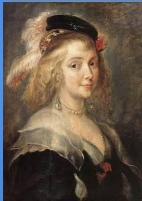
«Портрет жены художника»