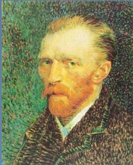
Художник ВАН ГОГ