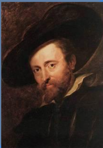
Художник Питер Паул Рубенс