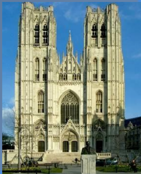
Собор Святого Михаила