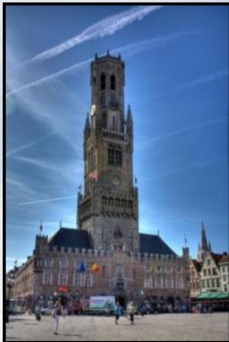
Дозорная башня Белфорт