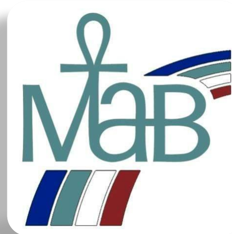
Международная программа ЮНЕСКО «Человек и биосфера».