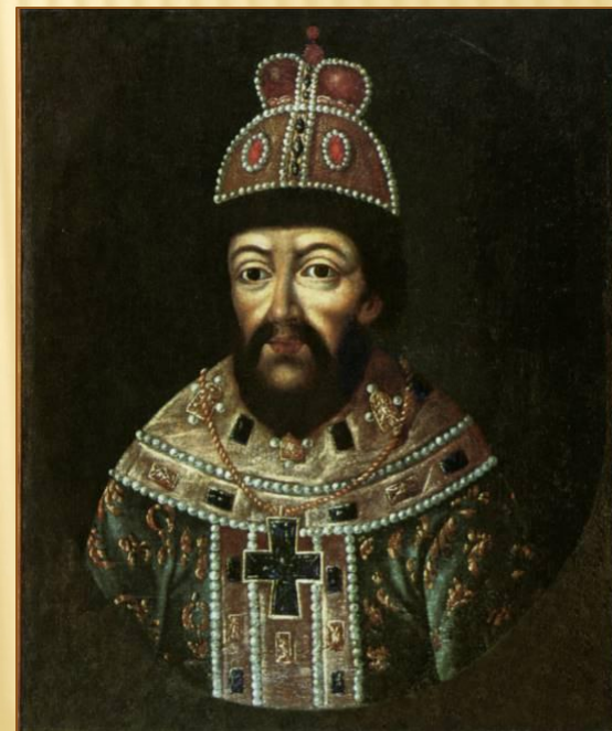
Царь Борис Годунов

После смерти царя Ивана Грозного московский трон зашатался. У царя было три сына. Старший умер, средний, был слабый. Что стало с младшим, Дмитрием, — неизвестно. То ли из-за болезни умер, то ли из-за несчастного случая. В народе слух ходил: убили царевича! И убийца тот, кто стал царём вместо него: Годунов Борис Фёдорович! Борис Годунов много хорошего для страны сделал, еще больше задумал. Но народ не простил ему смерти царевича Дмитрия. А тут ещё неурожай, голод. Кто виноват? Конечно, царь-убийца. И началось смутное время!