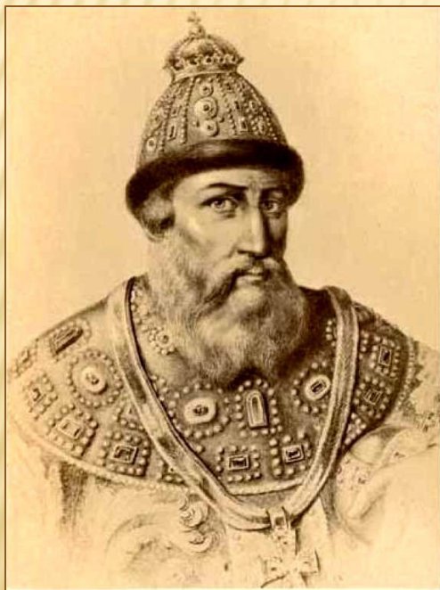
Царь Иван Грозный

После смерти царя Ивана Грозного московский трон зашатался. У царя было три сына. Старший умер, средний, был слабый. Что стало с младшим, Дмитрием, — неизвестно. То ли из-за болезни умер, то ли из-за несчастного случая. В народе слух ходил: убили царевича! И убийца тот, кто стал царём вместо него: Годунов Борис Фёдорович! Борис Годунов много хорошего для страны сделал, еще больше задумал. Но народ не простил ему смерти царевича Дмитрия. А тут ещё неурожай, голод. Кто виноват? Конечно, царь-убийца. И началось смутное время!