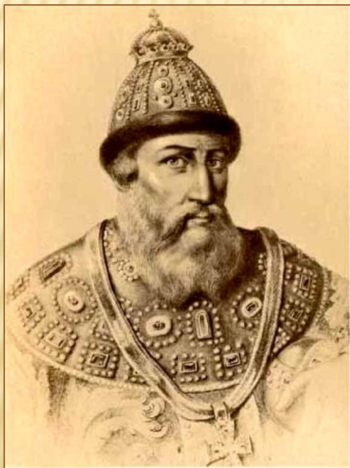
Царь Иван Грозный

После смерти царя Ивана Грозного московский трон зашатался. У царя было три сына. Старший умер, средний, был слабый. Что стало с младшим, Дмитрием, — неизвестно. То ли из-за болезни умер, то ли из-за несчастного случая. В народе слух ходил: убили царевича! И убийца тот, кто стал царём вместо него: Годунов Борис Фёдорович! Борис Годунов много хорошего для страны сделал, еще больше задумал. Но народ не простил ему смерти царевича Дмитрия. А тут ещё неурожай, голод. Кто виноват? Конечно, царь-убийца. И началось смутное время!