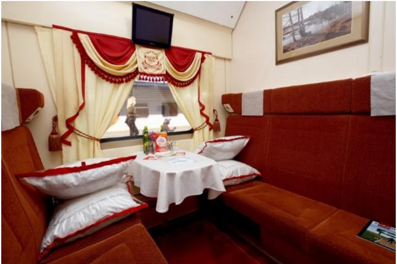
Вагон повышенного комфорта