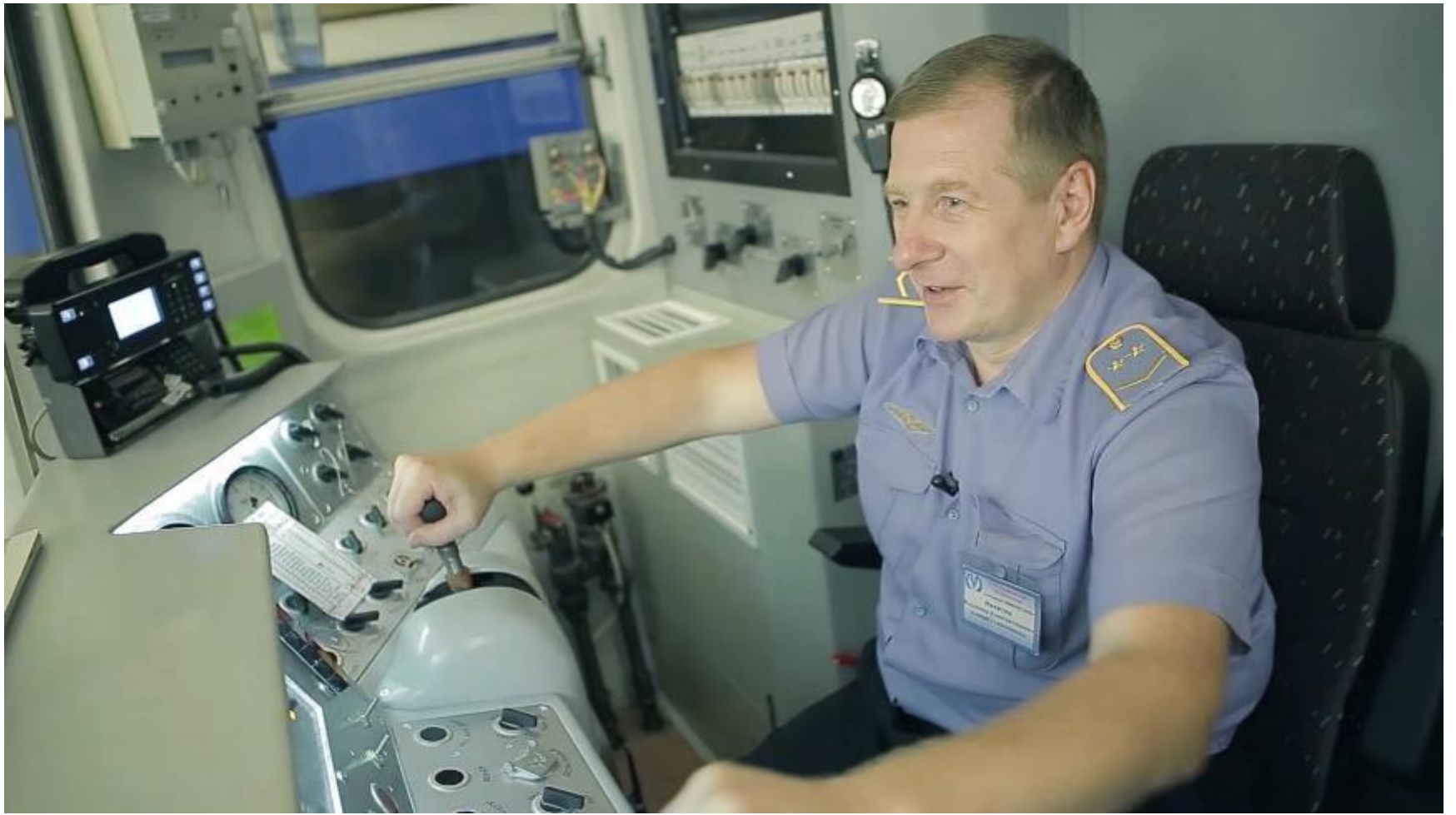
Машинист ведет поезд