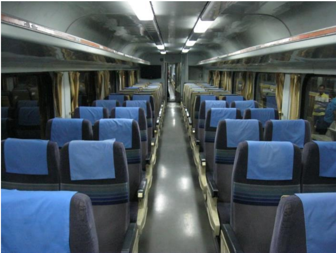
Вагон с сидячими местами.