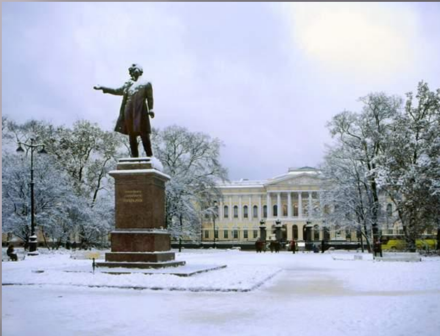
Памятник А.С. Пушкину на Площади Искусств