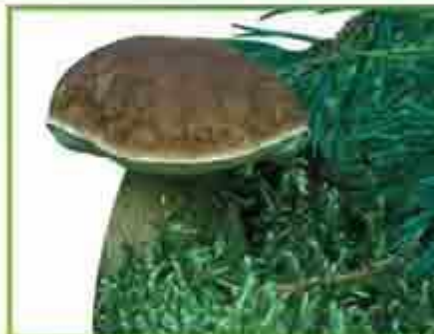
белый гриб (сосновый)