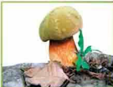
белый гриб (дубовый)