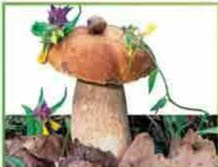
белый гриб (еловый)