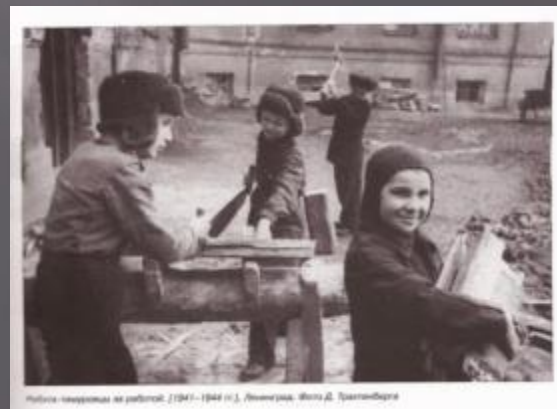
Работа подростков на работах. 1941-1944 гг., Ленинград.