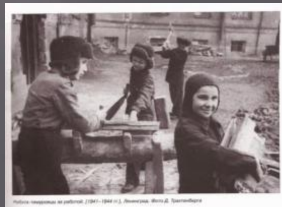
Работа подростков на рабочих (1941-1944 гг.), Ленинград.