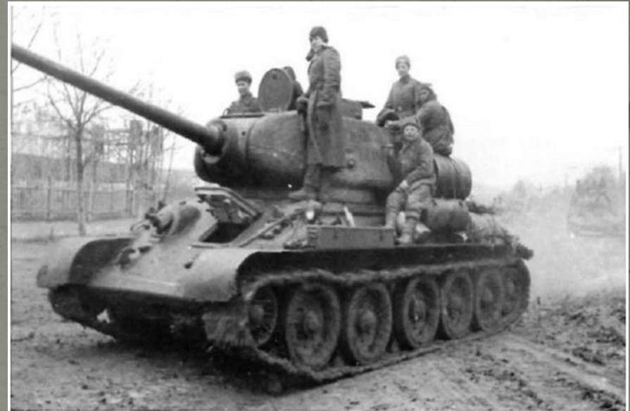
Concord-Russian Medium tanks 1941-1945 (page 47)